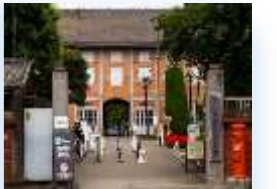
富岡製糸場 外観 (イメージ)

最少催行人員：30名様/バスガイドあり/添乗員なし/利用交通機関：貸切バス(多野観光)