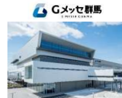
(Gメッセ群馬外観イメージ)