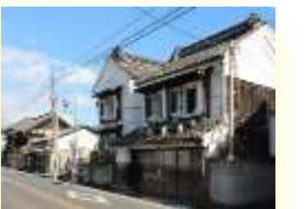
桐生新町重要伝統的建造物群保存地区 (イメージ)

最少催行人員：30名様/バスガイドあり/添乗員なし/利用交通機関：貸切バス(多野観光)