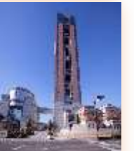
群馬県庁 (イメージ)

最少催行人員：30名様/バスガイドあり/添乗員なし/利用交通機関：貸切バス(多野観光)