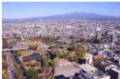
(左上：草津温泉イメージ 右上：尾瀬イメージ 中：群馬県イメージ 左下：富岡製糸場イメージ 右下：前橋市イメージ)