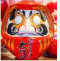
高崎 福だるま (イメージ)

高崎といえば「だるま」！少林山達磨寺で歴史と文化に触れた後、高崎だるまの絵付体験でオリジナルだるまを制作。そして芸術とパスタのまち高崎！高崎芸術劇場でパスタを楽しみ、ラスクで全国に名を轟かす「ガトーフェスタハラダ」の工場を見学します。 ご旅行代金：大人お一人様4,500円(貸切バス代・バスガイド代・体験代・昼食代含む) 集合場所・時間：高崎駅東口08:30出発(解散/高崎駅15:00予定)